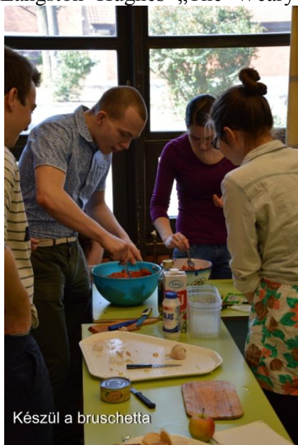
Készül a bruschetta