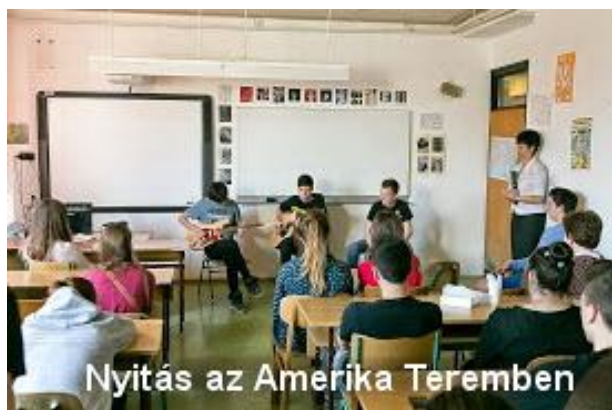
Nyitás az Amerika Teremben